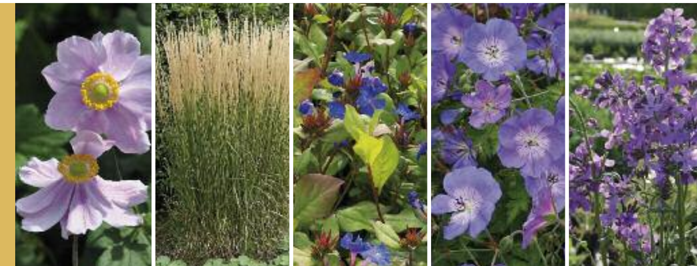
Herbst-Anemone Anemone japonica 'Serenade' Höhe 120 cm Blütezeit Aug–Okt Reitgras Calamagrostis x acutiflora 'Karl Foerster' Höhe 150 cm Blütezeit Juli–Aug Bleiwurz Ceratostigma plumbaginoides Höhe 25 cm Blütezeit Aug–Okt Storchschnabel Geranium pratense 'Rozanne' Höhe 45 cm Blütezeit Mai–Okt Nachtviole Hesperis matronalis Höhe 65 cm Blütezeit Mai–Juli