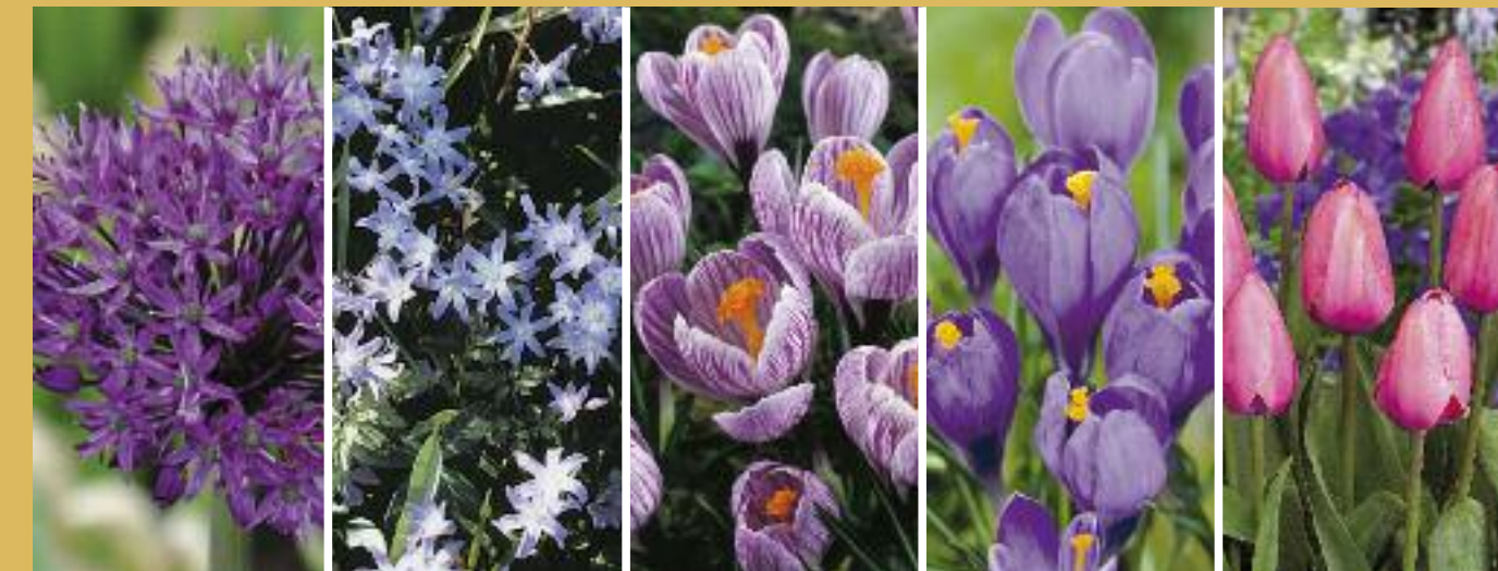
Zierlauch Allium 'Purple Sensation' Höhe 80 cm Blütezeit Mai–Juni Schneeglantz, Schneestolz Chionodoxa luciliae Höhe 15 cm Blütezeit März Krokus Crocus 'Pickwick' Höhe 15 cm Blütezeit März–April Krokus Crocus 'Remembrance' Höhe 15 cm Blütezeit März–April Tulpe Tulipa 'Pink Impression' Höhe 55 cm Blütezeit April