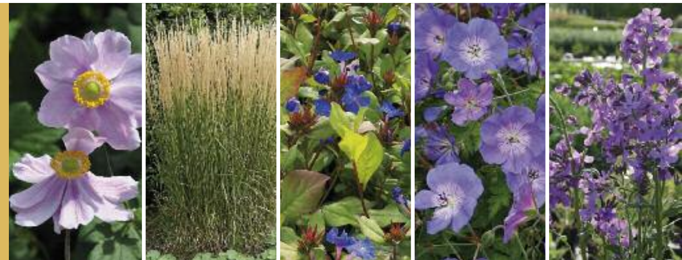
Herbst-Anemone Anemone japonica 'Serenade' Höhe 120 cm Blütezeit Aug–Okt Reitgras Calamagrostis x acutiflora 'Karl Foerster' Höhe 150 cm Blütezeit Juli–Aug Bleiwurz Ceratostigma plumbaginoides Höhe 25 cm Blütezeit Aug–Okt Storchschnabel Geranium pratense 'Rozanne' Höhe 45 cm Blütezeit Mai–Okt Nachtviole Hesperis matronalis Höhe 65 cm Blütezeit Mai–Juli